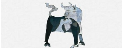
1. Toro con cara de miedo