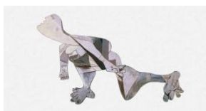
7. Mujer arrodillada