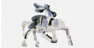
5. Caballo que grita