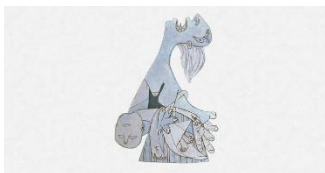
3. Mujer con niño muerto